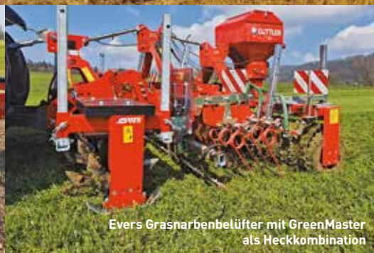
Evers Grasnarbenbelüfter mit GreenMaster als Heckkombination