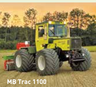
MB Trac 1100

Antworten und Einblick in seine jahrzehntelangen Praxisbeobachtungen gibt Ihnen Hans Güttler in Verbindung mit den Live-Demonstrationen. Profitieren Sie von seinem Wissen live am Feldtag!