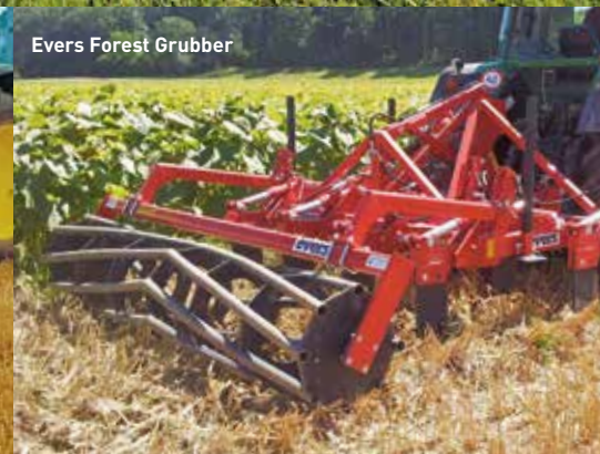
Evers Forest Grubber