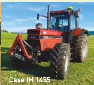
Case IH 1455