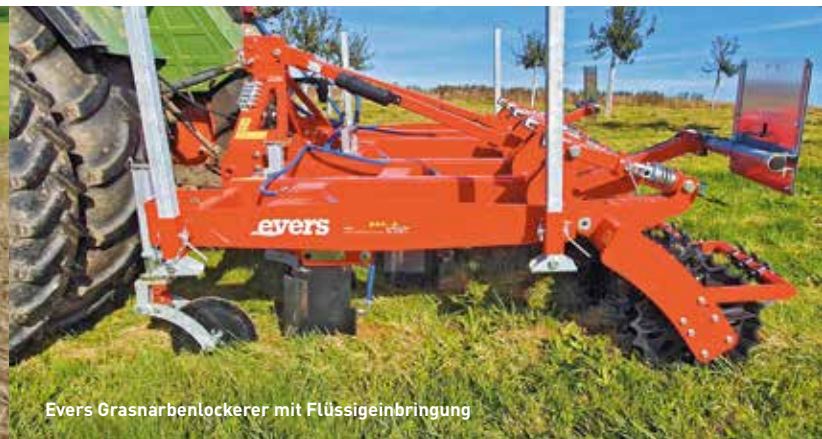
Evers Grasnarbenlockerer mit Flüssigeinbringung