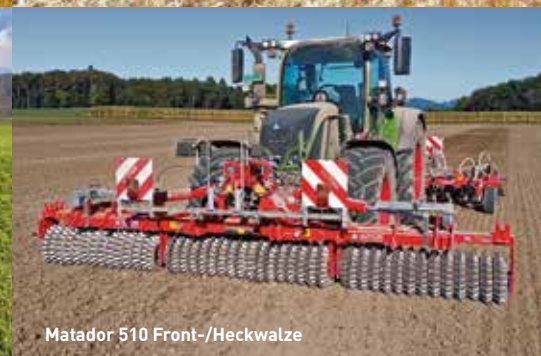
Matador 510 Front-/Heckwalze