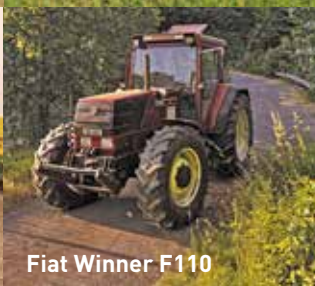
Fiat Winner F110