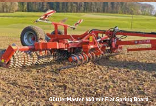
GüttlerMaster 640 mit Flat Spring Board