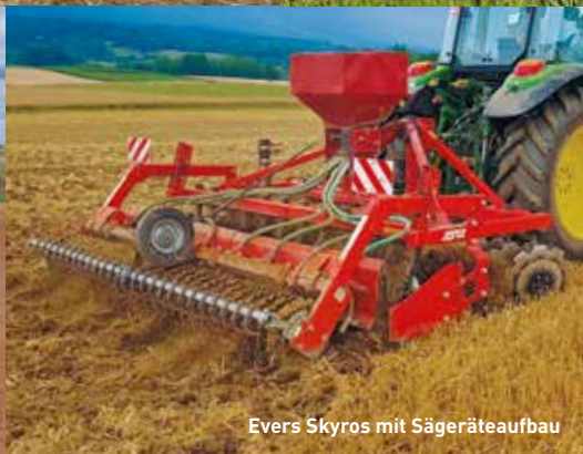
Evers Skyros mit Sägeräteaufbau