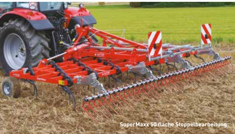
SuperMaxx 50 flache Stoppelbearbeitung

Auszug aus unserem Programm multifunktionaler Lösungen