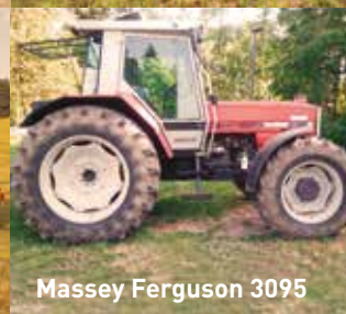
Massey Ferguson 3095