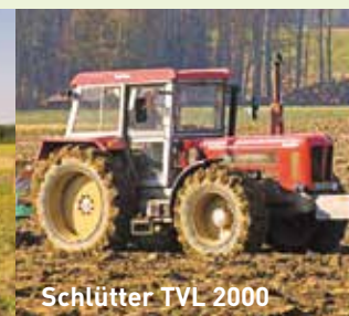
Schlütter TVL 2000