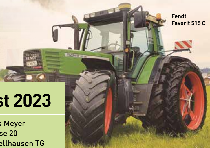
Fendt Favorit 515 C