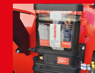
AGS (Automatische Zentralschmieranlage)