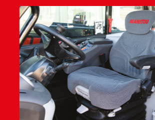
Adaptiver luftgefederter Fahrersitz