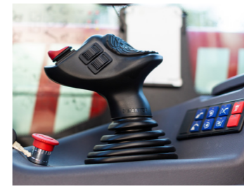
Ergonomischer JSM Für maximalen Komfort

Übersicht Klicken Sie hier, um Ihre zukünftige Kabine zu entdecken