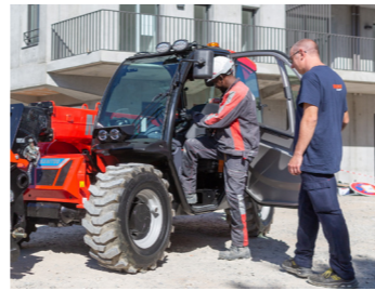
Optimaler Kabinenzugang Nur ein Schritt