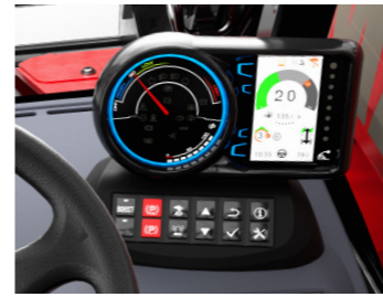
Intuitive Anzeige 22 Sprachen